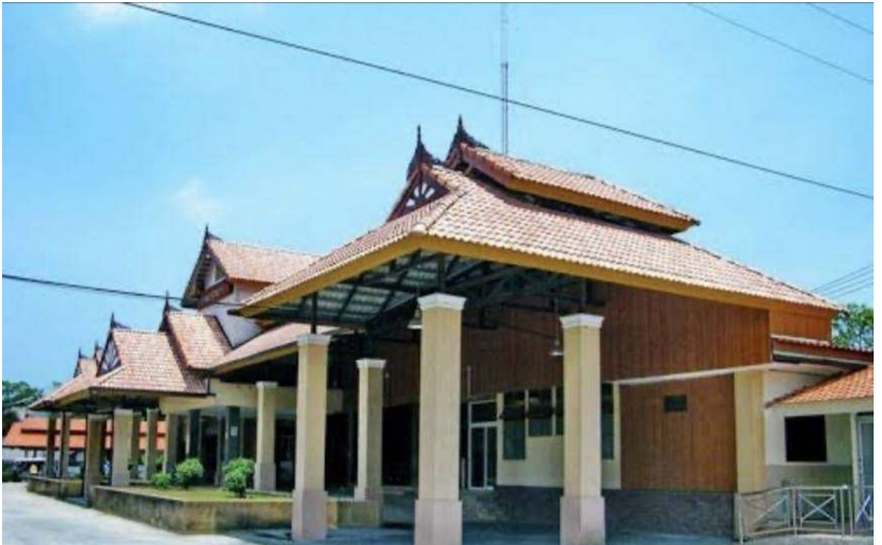
โรงพยาบาลบาเจาะ จังหวัดนราธิวาส ประจำปีงบประมาณ ๒๕๖๗

รายงานผลการดำเนินงานตามแผนปฏิบัติการป้องกัน ปราบปรามารทุจริต และประพฤติมิชอบ และรายงานผลการดำเนินงานตามแผนปฏิบัติการส่งเสริมคุณธรรมของชมรมจริยธรรม ประจำปีงบประมาณ ๒๕๖๗ รอบ ๑๒ เดือน (ตุลาคม ๒๕๖๖ - สิงหาคม ๒๕๖๗)